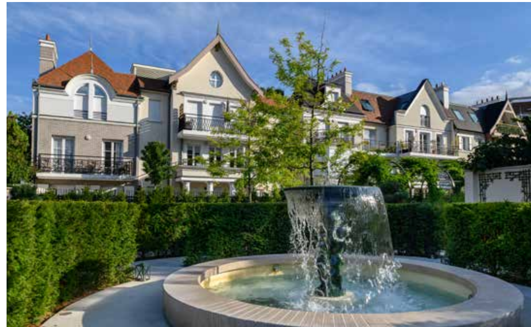
Notting Hill à Puteaux Architecte : Lionel de Segonzac