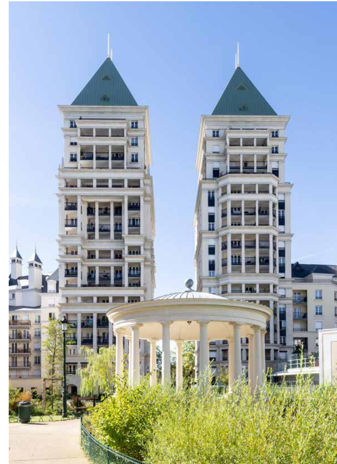
Quest Village à Puteaux Architectes : Marc Breitman et Nada Breitman