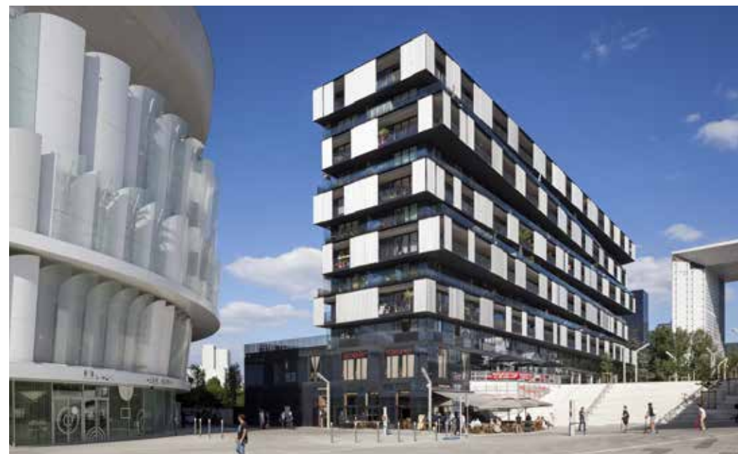
The One à Nanterre Architecte : Farshid Moussavi Architecture