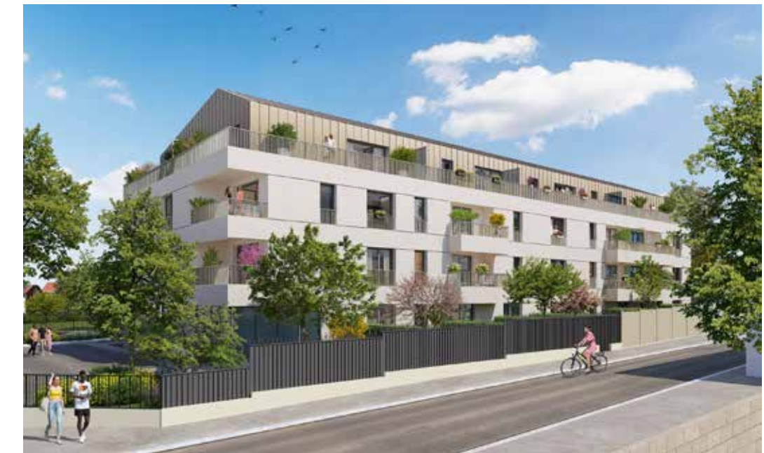
Résidence Le Coty à Ambarès-et-Lagrave Architecte : Agence M2L Architectes