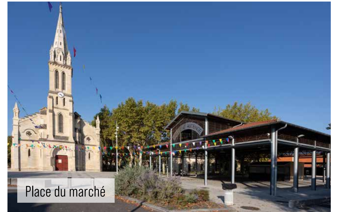
Place du marché