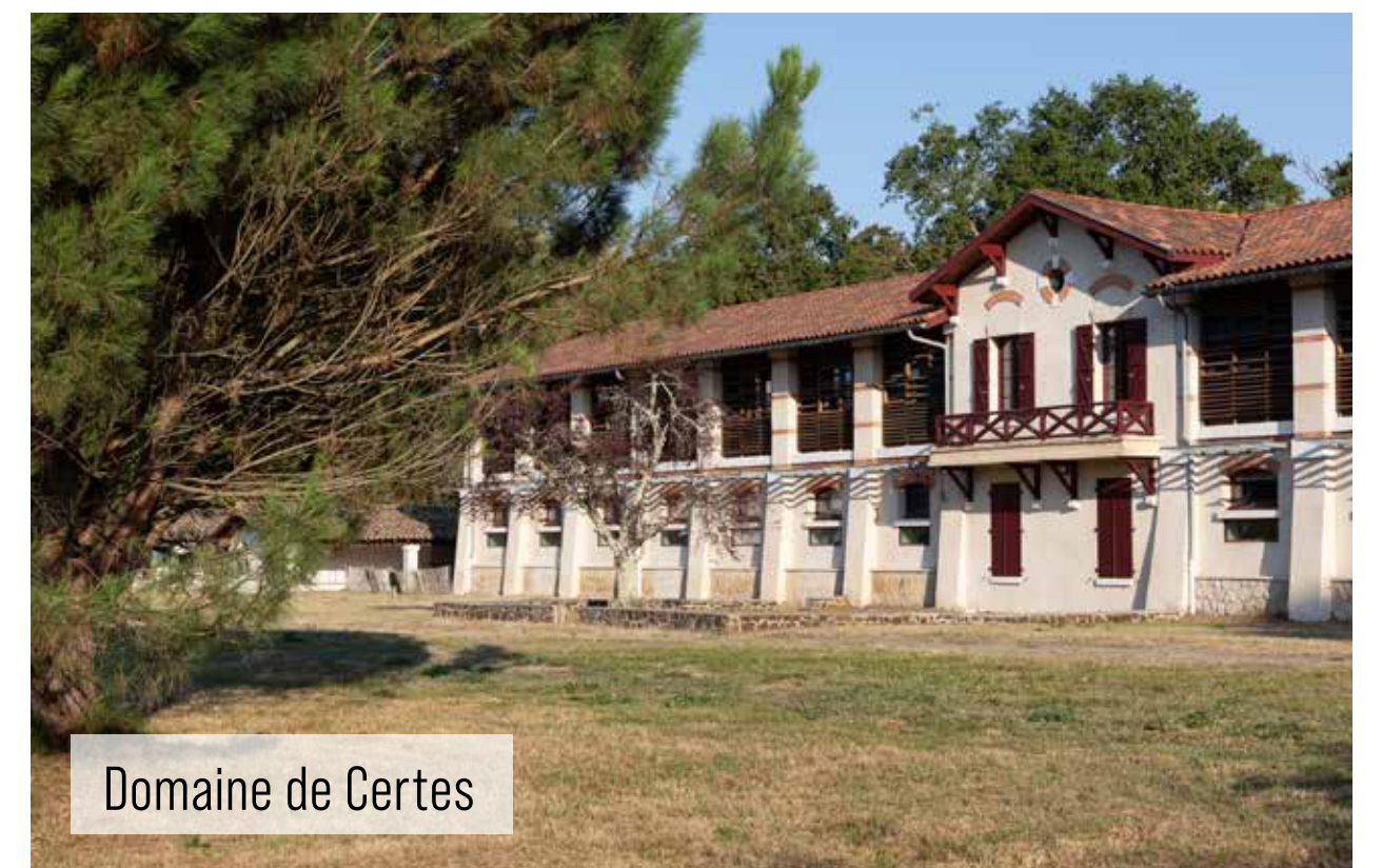
Domaine de Certes