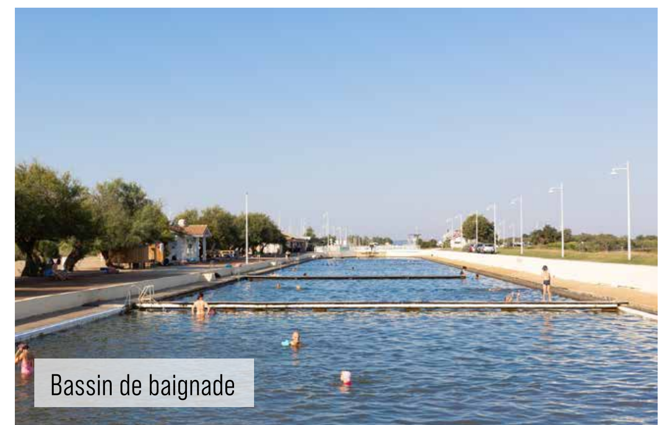
Bassin de baignade