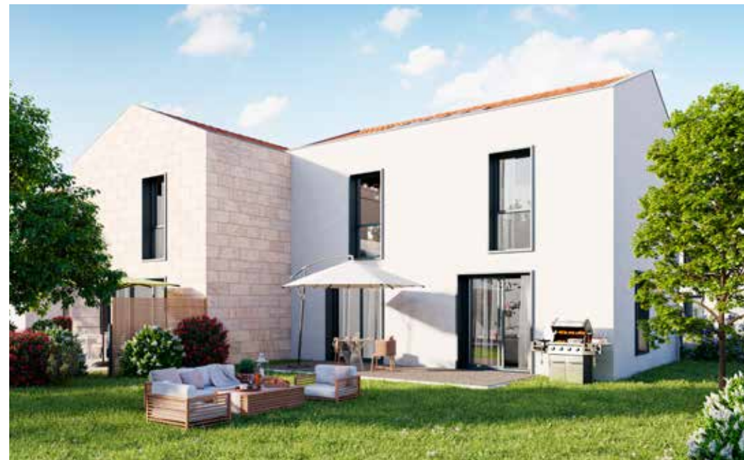
Villa Brugeaise à Bruges Architecte : Atelier Alonso Sarraute