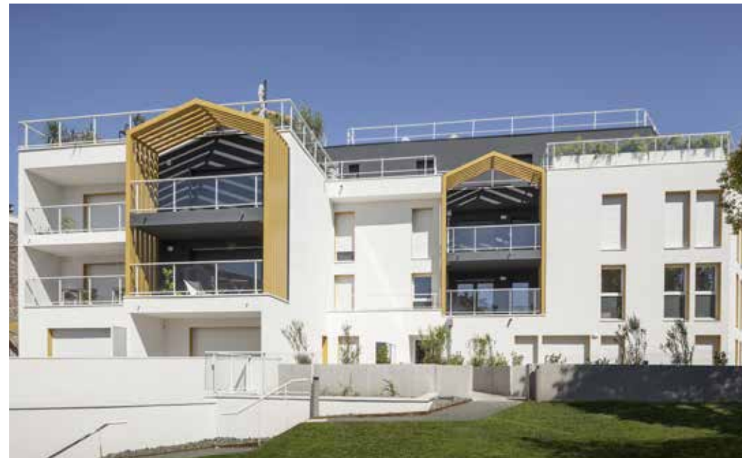
Les Terrasses de Saint-Augustin à Mérignac Architecte : Agence d'architecture URB1N