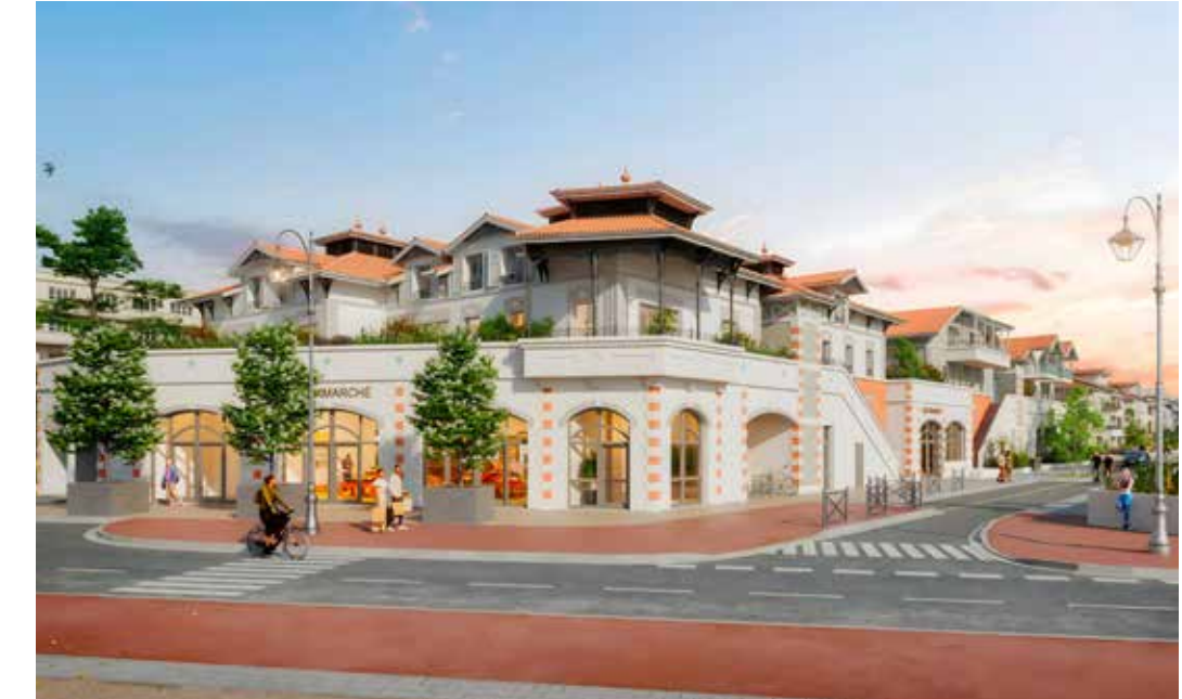
Villas Beurivage à Arcachon Agence d'architecture : Agence De Folmont et Camus