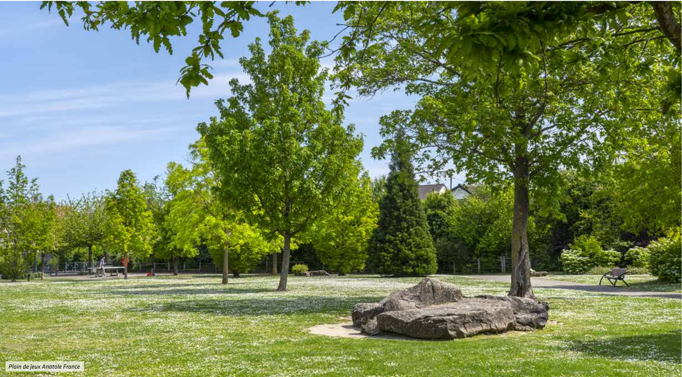
Plain de jeux Anatole France

Ici, les Beauchampois plébiscitent aussi les écoles bien cotées de la maternelle au collège. Quelque 30 acteurs favorisent une vie associative enrichissante et animent une belle palette d'équipements : médiathèque, centre omnisports, stade, parc sportif, école de musique, saison culturelle pour tous avec représentations régulières à la salle des fêtes. Les petits commerces et services, que complète un marché bihebdomadaire, confortent l'esprit village de Beauchamp. S'y ajoute l'attractivité de la zone commerciale de la Patte d'Oie d'Herblay à quelques minutes en voiture.