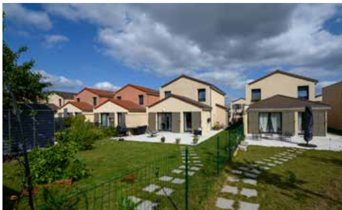
Les Allées De Beauvoir - Cormeilles-en-Parisis Architecte : Agence d'architecture 2AD