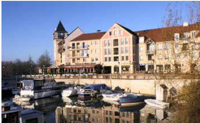
Port Cergy - Cergy Architecte : François Spoerry