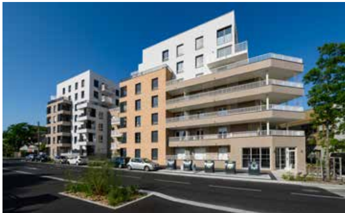
Le Domaine de la Chesnaie II - Montigny-lès-Cormeilles Architecte : Sathy Architecture