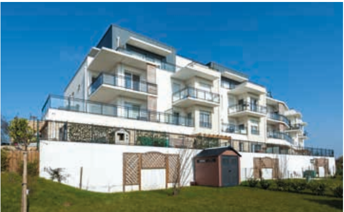
Les Terrasses de Domont à Domont (95) Architecte : Atelier BLM : Elliott Laffitte