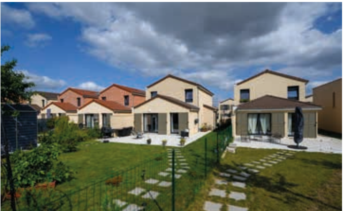
Les Allées De Beauvoir à Corneilles-en-Parisis (95) Architecte : Agence d'architecture 2AD