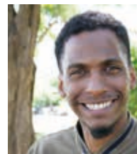
Benoît Zachelin-Sainte-Croix B -Landscape

Les quatre bâtiments formant le second îlot s'agencent, pour leur part, autour d'un cœur très verdoyant, dessiné par de généreux jardins individuels. Les lieux ont aussi la particularité d'être marqués par un charme 'monumentalis', jouxtant le local vélos extérieur, et venant ponctuer le paysage de son port colonnaire. Attire également le regard un massif planté d'oreilles d'ours au feuillage laineux gris argenté, d'érigérons aux fleurettes blanches et roses, ainsi que d'immortelles d'Italie à la floraison jaune d'or. »