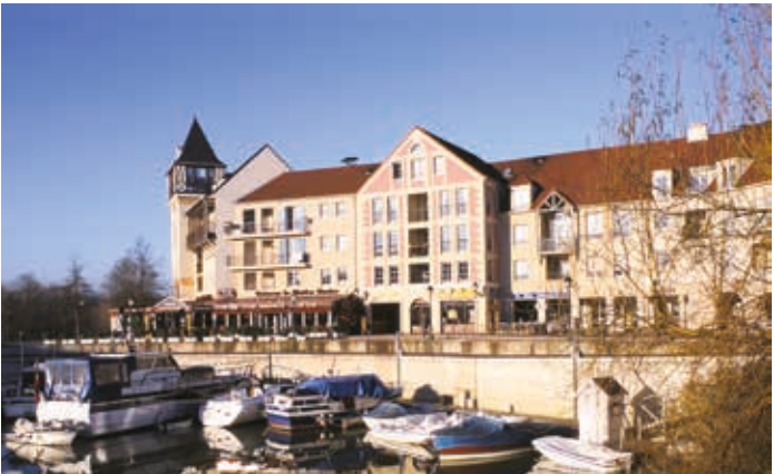
Port Cergy à Cergy (95) Architecte : François Spoerry